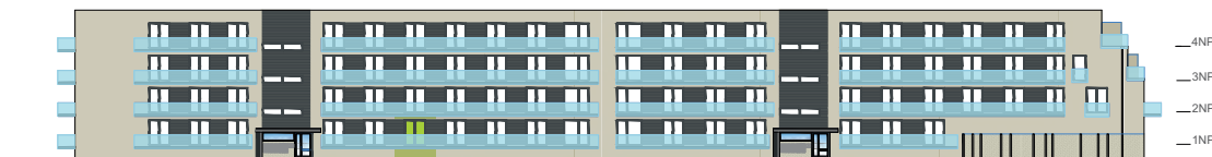
Severní pohled na dům / Building View - north side