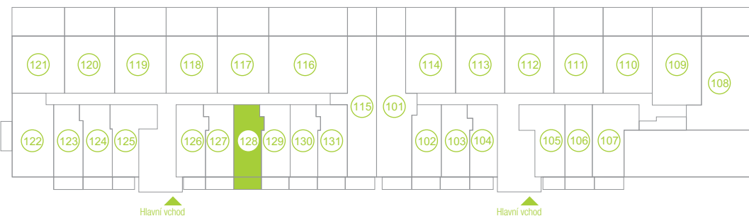
Půdorys podlaží / Floor plan