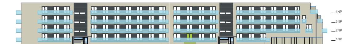
Severní pohled na dům / Building View - north side